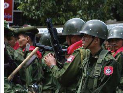
Εκτοξευτές οπλοβιβίων που χρησιμοποιήθηκε από τις δυνάμεις ασφαλείας της Μιανμάρ κατά την διάρκεια διαδηλώσεων στην Γιανγκόν, 28 Σεπτεμβρίου του 2007.